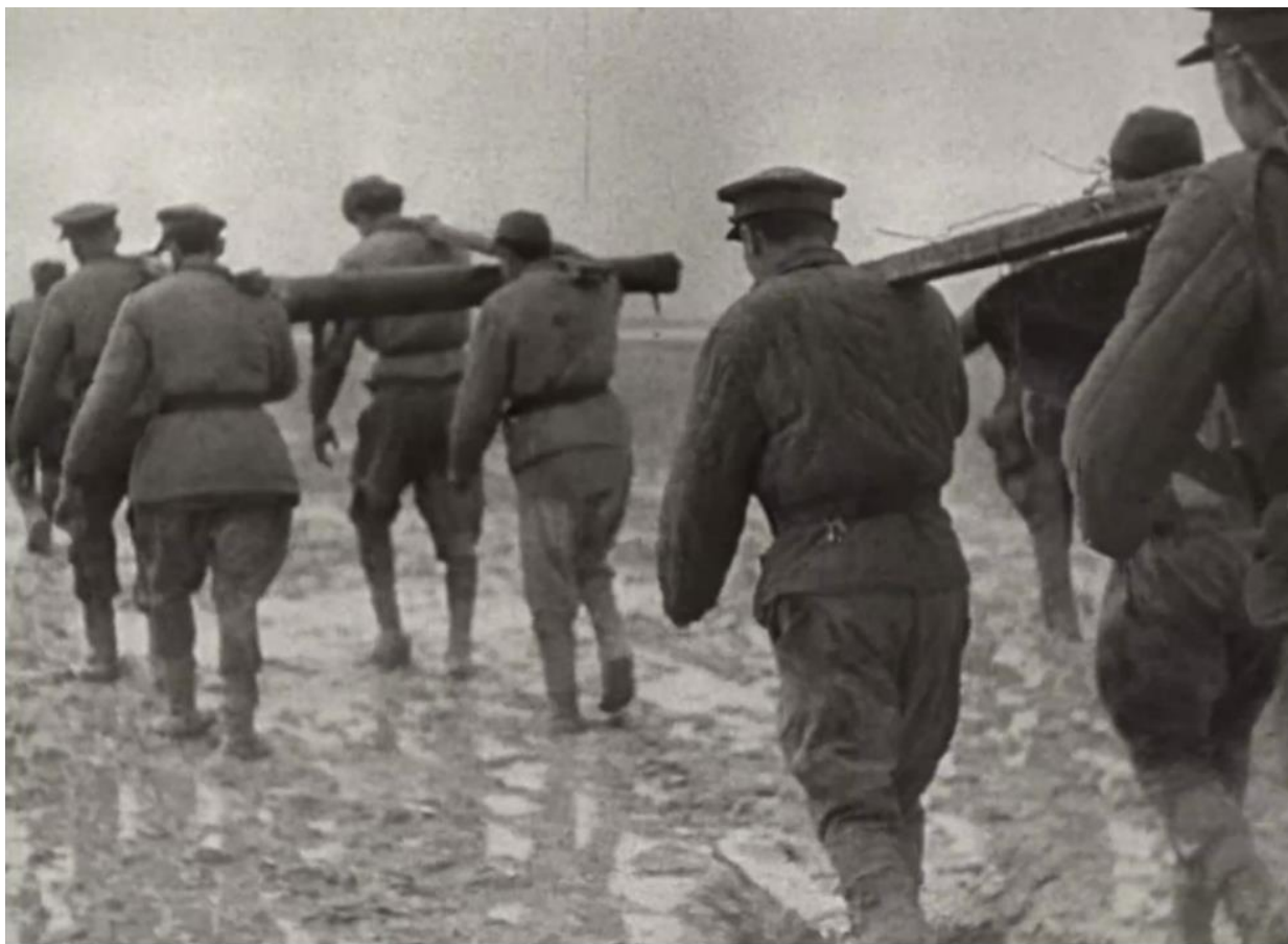
Рисунок 4 – Кадр из фильма «Зеркало» [4]

Родины, и всего человечества. Во всеединство – как это формулирует главная русская философская традиция.