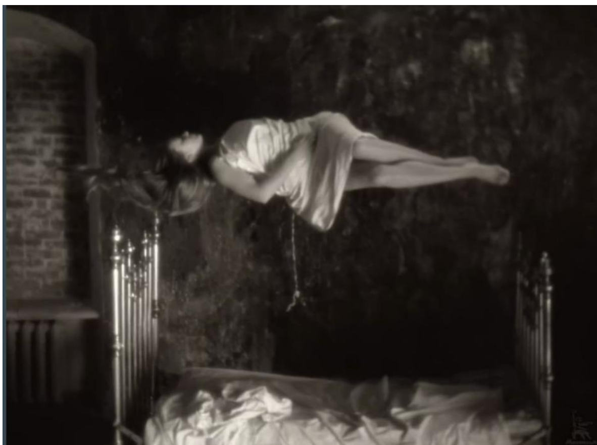
Рисунок 3 – Кадр из фильма «Зеркало» [4]

Для роста жертва должна стать обоюдной. При этом обоюдность – это не «ты мне – я тебе». Когда к нам приходит любовь к другому человеку – это требование к нему, требование жертвы. И то же самое, когда к нам приходит анализант. Любовь дает нам дар, который нужно вернуть, возможно, другому человеку. Так любовь проходит сквозь нас, преобразуя мир.