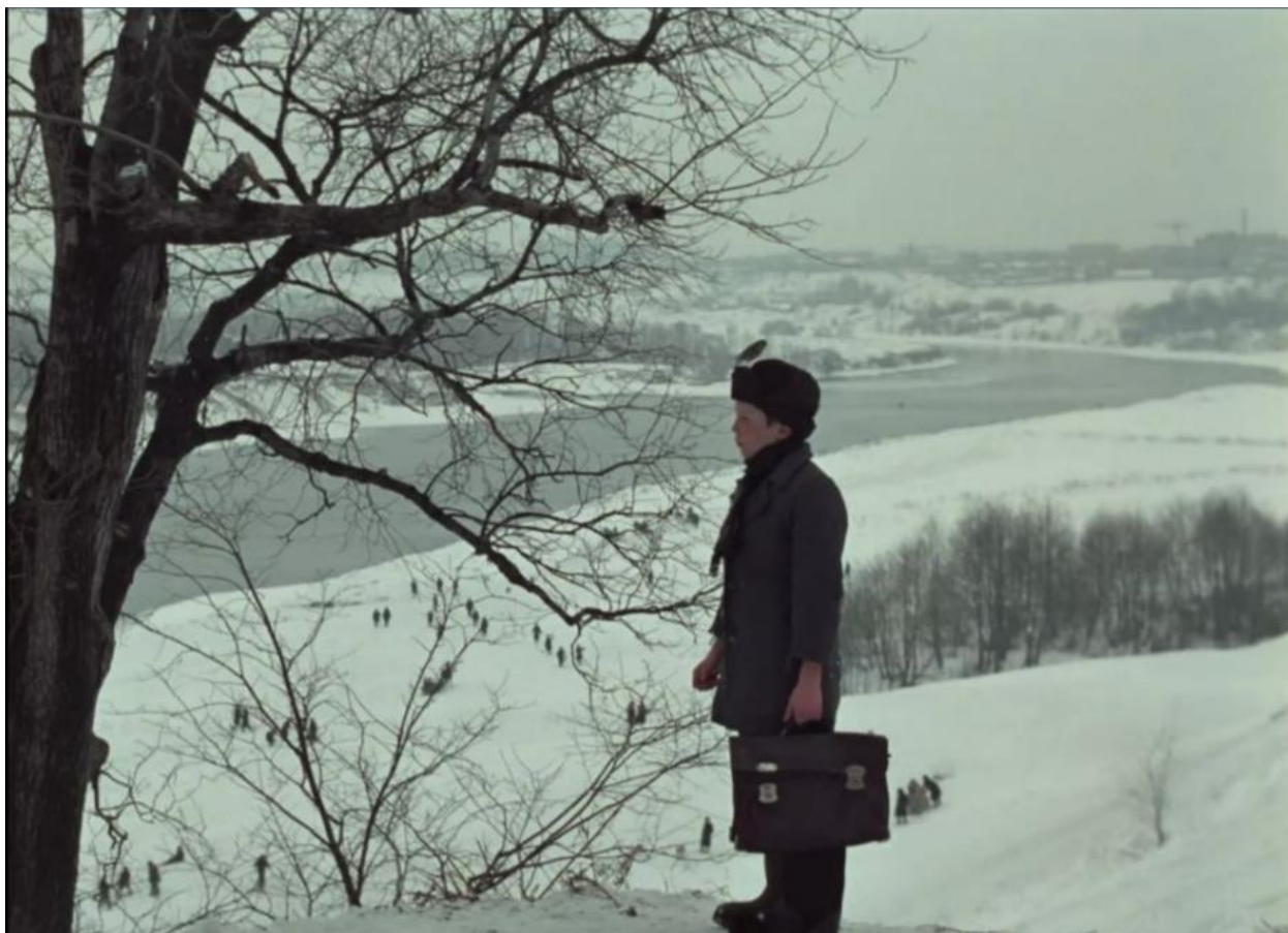
Рисунок 2 – Кадр из фильма «Зеркало» [4]

Эпизод с мальчиком Асафьевым и военруком в фильме «Зеркало» – центральный в идейном и сюжетном плане. Эпизод построен на противостоянии военрука и мальчика Асафьева, блокадного ребенка, которое изначально выглядит как странное непонимание. Асафьев не понимает команды военрука, такие как «Кругом!» или «На огневую позицию шагом марш!» , трактуя их буквально или задавая уточняющие вопросы. Это непонимание символизирует конфликт между божественным Словом, соответствующим истинной сущности вещей, и «адским» словом, которое механистично, формально и убивает смысл.