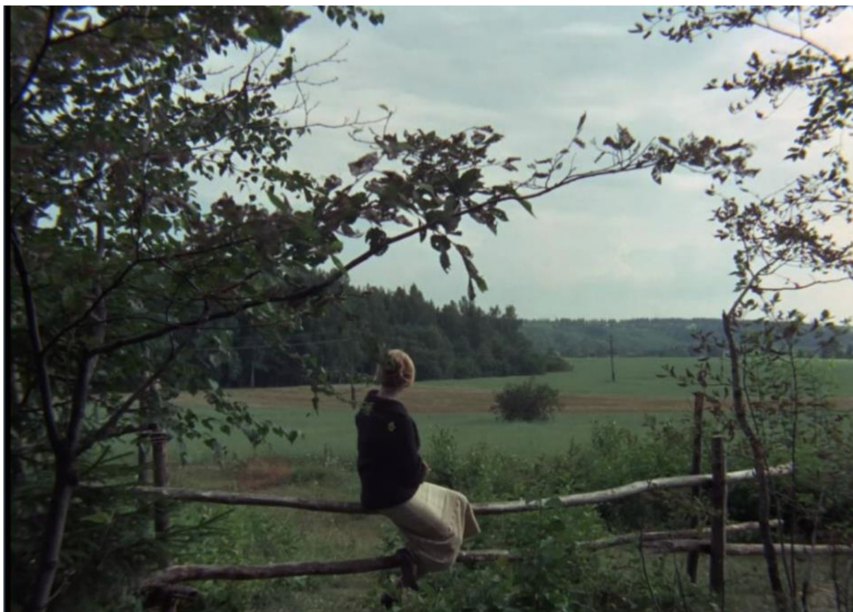
Рисунок 1 – Кадр из фильма «Зеркало» [4]

И дальше мы погружаемся в психическую реальность главного героя «Зеркала», которая говорит с нами бесконечно разнообразными способами: словами, жестами, живописью и образами, молчанием, криками, слезами, ветром, водой, землей, красками и их отсутствием.